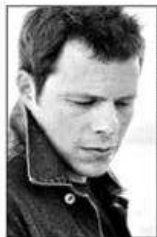
Direção: Mánya Millen

de meu clássico são iro é 'Crime e castigo', que se sabe sobre esse o primeiro Dostoiévski ois li tudo dele. E meu o é 'O grande Gatsby', izgerald, outro escritor los os romances. Já reli ro vezes. É um livro tão até a adaptação para o a que nunca funciona esultou num filmaço."