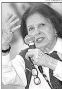
LYGIA: dupla homenagem

Lygia só cresce. Com o lançamento da série Autor por Autor, Lygia Fagundes Telles ganhou uma homenagem. Ho- tro Eva Herz, em São Paulo, a estreia da obra "Lygia por Lygia", adaptada e dramatizada por Amaral. O programa de romances de Lygia, lançado em 1973. A obra de Yara de Sá, a estreia de "Lygia por Lygia", à noite, às 21h, no Sesc (tam- bilho), haverá a pré-estreia de "Lygia por Lygia", ma da série Autor por Autor, que pretende blico de grandes nomes da literatura brasileiro jornalista Paulo Markun, com texto de Ma- participação de Eva Wilma, Regina Braga e o programa estreará na TV Cultura dia 11.